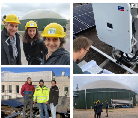
Projekte für erneuerbare Energie vorangetrieben.

Auch dieses Jahr blicken wir im Bereich Energieversorgung auf diverse Highlight zurück.